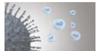
Aktiviteten til forurensende stoffer hemmes.